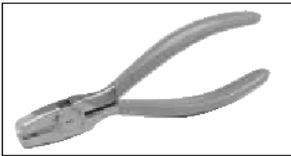
Economy (E.T.) Tool: Parti No 231839-1